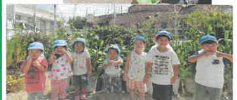
(トウモロコシの前で)