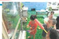
【おばけちゃんをやっつける！】

ひよこ組は初めてのプール。水にもだんだん慣れて、りす組が「雨～」とシャワーをかけて園庭を走っていると、参加するひよこさん何人か出てきました。ウォーターポンプも上手に打って、「的あて」もしました。りす組の子ども、指がシワシワになるまでプールに浸かって、まるでリゾート地♪泥んこ遊びも楽しみました！暑い日はもう少し水遊びを楽しみたいと思います。